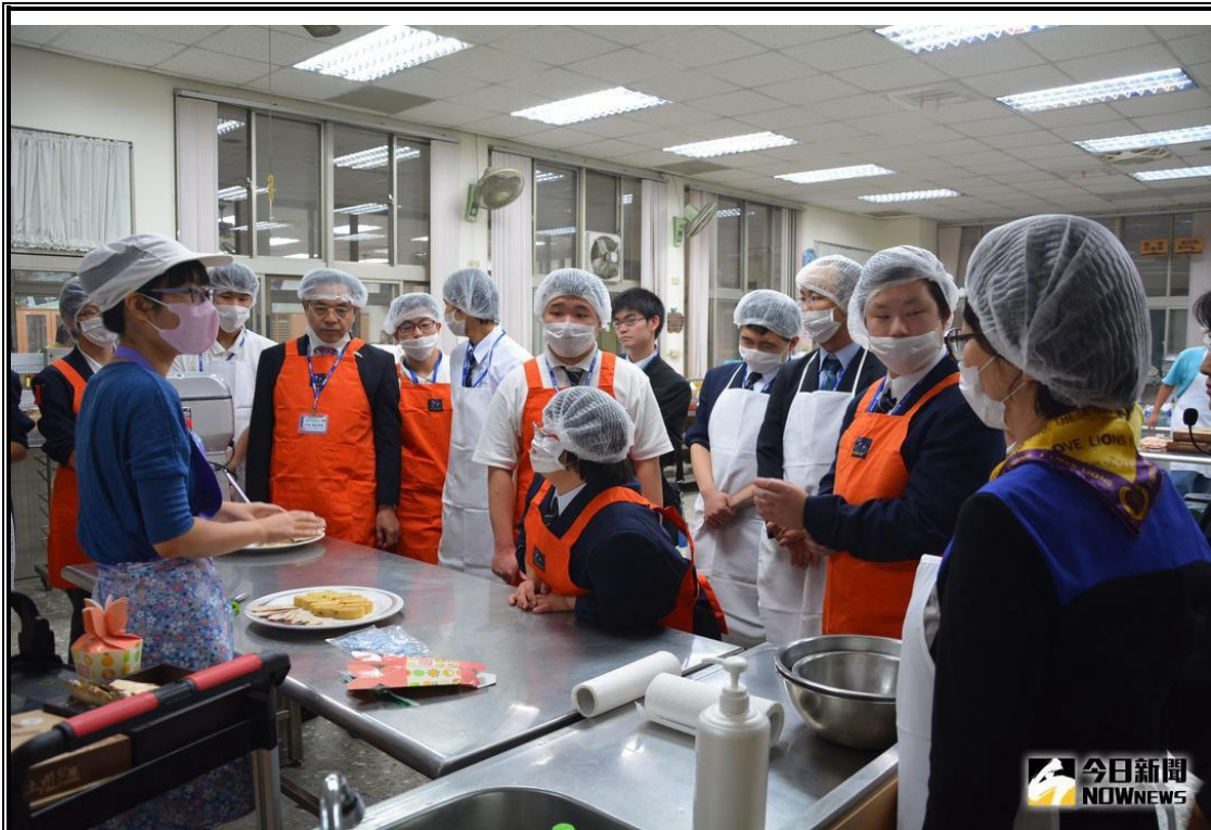
▲嘉義特教學安排讓日方學生製作土鳳梨酥帶回家

國立嘉義特教學校在 104 年與日本廣島縣立尾道特別支援學校締結為姐妹學校，今（21）天日校在該校校長服部秀樹領隊下，隨行 4 位老師及 10 名高校生一行 15 人蒞臨嘉特，這是該校第 3 年造訪台灣，也是日方首次有特教學生來訪，而此行並也開啟台日兩國特殊教育學校特教生的文化教學交流的先河。